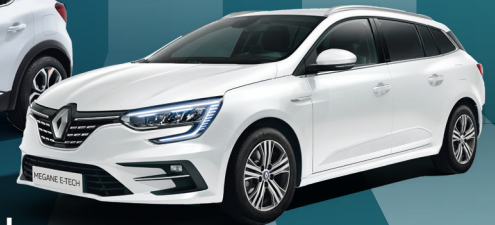
MEGANE E-TECH PLUG-IN HYBRID Grandtour bereits ab € 23.990,- brutto 2

Gesamtverbrauch: Renault Plug-in Hybrid Range von 1,7 – 1,3 l/100 km, CO 2 -Emission 37 – 28 g/km., Zoe: Stromverbrauch: 17,3–19,1 kWh/100km, homologiert nach WLTP.