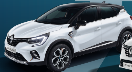
CAPTUR E-TECH PLUG-IN HYBRID bereits ab € 24.290,- brutto 2

Renault verlängert die Investitionsprämie bei Finanzierung! 1 Und bei unseren Plug-In Hybrid Modellen wird sie sogar verdoppelt! 1